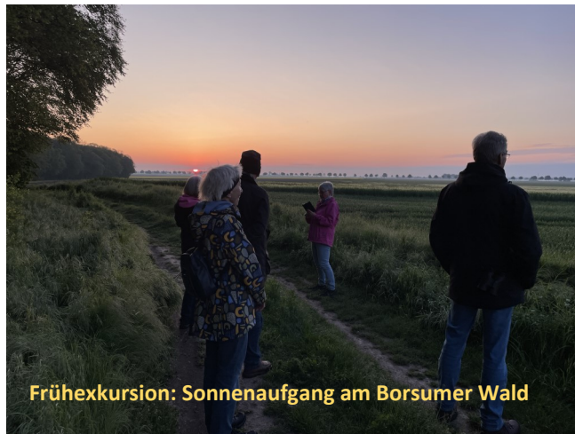
Frühhexkursion: Sonnenaufgang am Borsumer Wald

Beginn: 19:00 Uhr, Jugendheim, Martinstraße 59 in Borsum