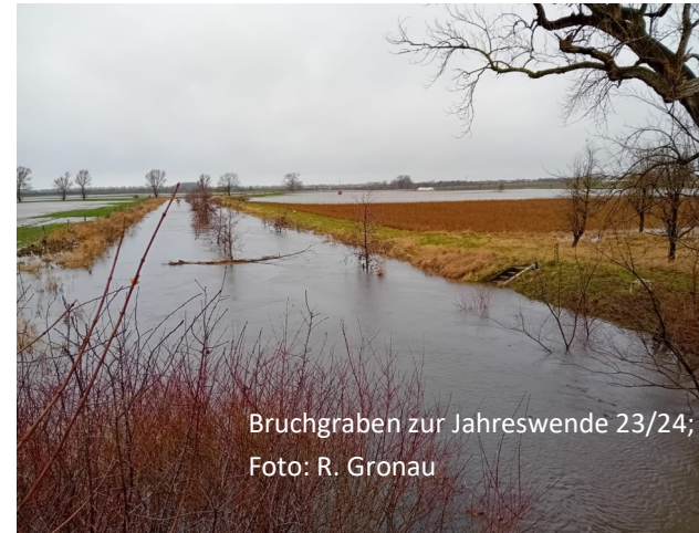
Bruchgraben zur Jahreswende 23/24; Foto: R. Gronau

Hinweis: bei nasser Witterung findet die die Monatsversammlung wie gewohnt um 19 Uhr im Jugendheim, Martinstraße 59 in Borsum, statt.